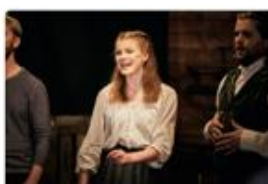
Gjertin E. Kirkeelide Kategori: Teater Sted: Strvn, Vestland